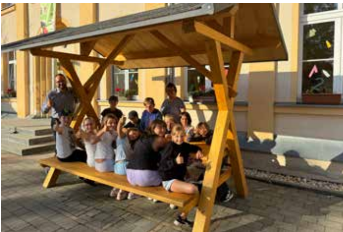
Das Team der Grundschule Teichwolframsdorf.