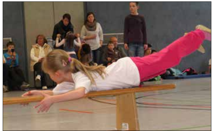
Bummi-Sportfest in der Turnhalle Teichwolframsdorf. Mit Begeisterung kämpften die kleinen Sportler um den Sieg. Die KITA Sonnenschein, Mannschaft 1, schaffte den 1. Platz.