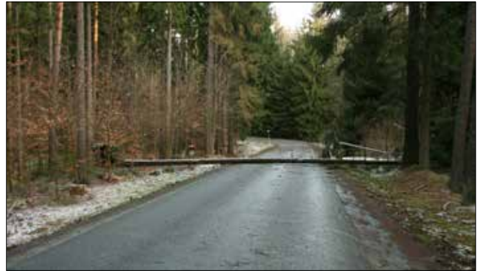
Der Sturm Niklas fällte Bäume auf der Straße nach Kahmer und auf der „Waldautobahn“