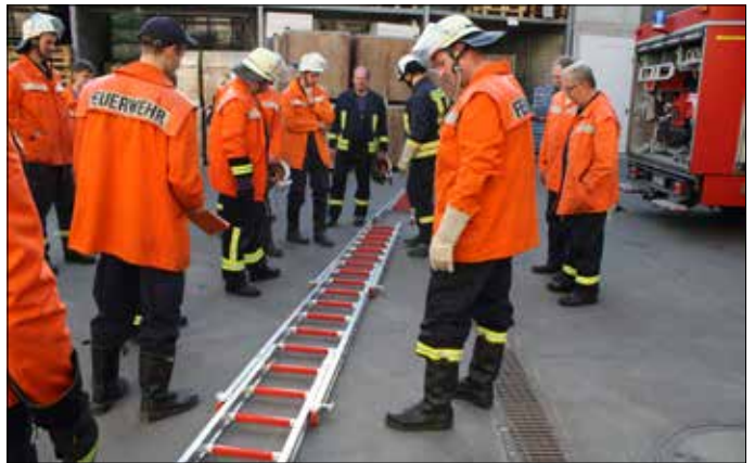
Impressionen vom zentralen Ausbildungstag der Freiwilligen Feuerwehren in Kleinreinsdorf.