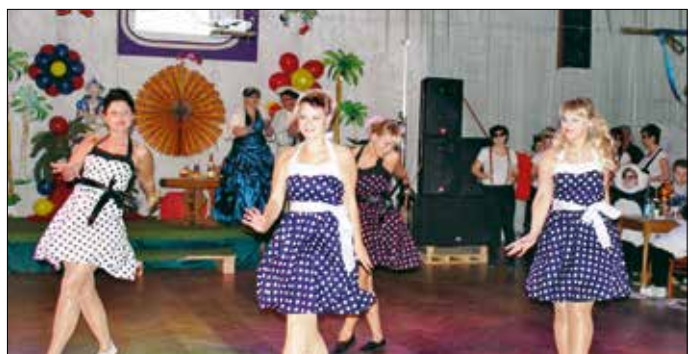
Impressionen vom 3. Narrenwettstreit des TCC '84 e.V.