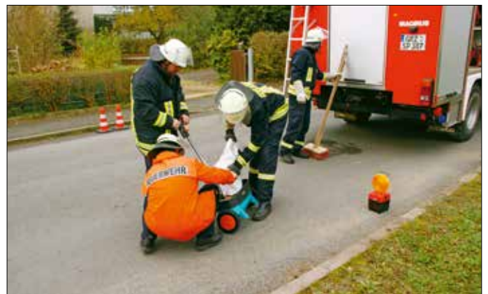
Feuerwehreinsatz zur Beseitigung einer Ölspur auf der Straße der Einheit in Mohlsdorf am 14.11.2014