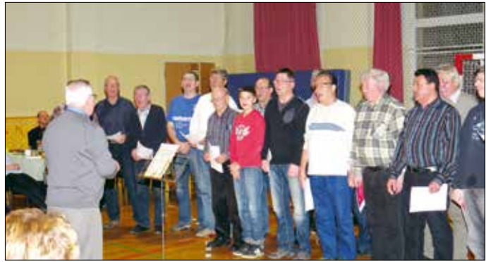
Musikantenstammtisch in Reudnitz. Zweimal im Jahr treffen sich Musikanten und eine immer größer werdende Schar von Gästen zum Musizieren. Spitze war bei den Musikanten der erstmals aufgetretene Chor des Stammtisches der Concordia und des Mohlsdorfer Männerchores, um nur einige zu nennen.