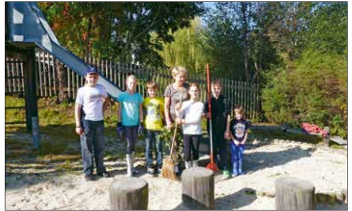
Fleißige Helfer bei dem Arbeitseinsatz am Kinderspielplatz Beethovenstraße. Einen Dank allen Beteiligten.