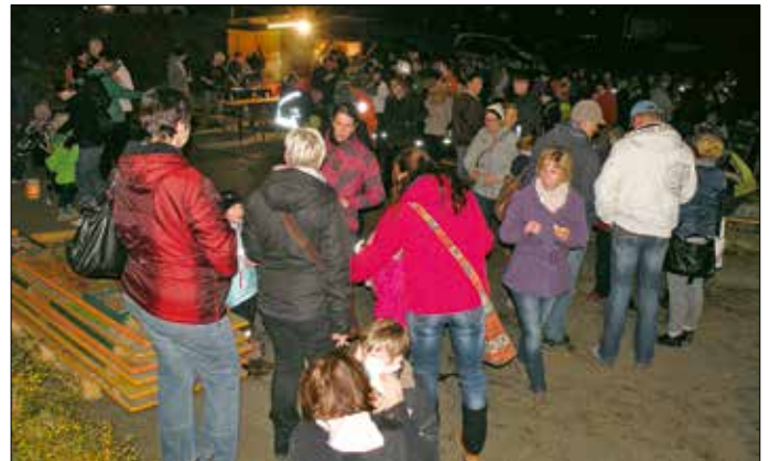
Ein schon zur Tradition gewordener Martinsumzug von der Schule und KITA Mohlsdorf zum Sportplatz des FSV. Dort wurde auch das Martinsfeuer angezündet.