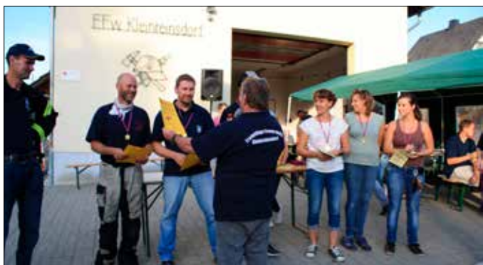
FFW und Feuerwehrverein Kleinreinsdorf e.V.

Ein Dankeschön geht ebenfalls an den Feuerwehrverein Kleinreinsdorf e.V., der am 18.09.2019 zur Verkehrsteilnehmerschulung eingeladen und diese durchgeführt hat.