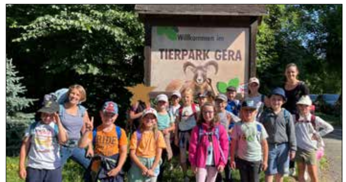
Die Schüler und Schülerinnen der Klasse 2