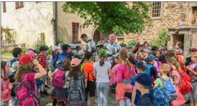
Klasse 2 der Grundschule Mohlsdorf

Am 5. Juni 2023 hat die gesamte Grundschule Mohlsdorf bei schönstem Sonnenschein einen Schulausflug zur Leuchtenburg unternommen. Ob die fast 1.000-jährige Geschichte der mittelalterlichen Burg hoch über dem Saaletal oder die interaktive Ausstellung zur spannenden Geschichte des Porzellans, die Schüler kamen aus dem Staunen nicht heraus. Man erfuhr in einer einstündigen Führung viele interessante Details zur Burg und dem Herstellungsprozess des Porzellans, förderte mühsam im Laufrad das Wasser aus dem tiefen Brunnen-schacht und stieg ins schauerliche Burgverlies. In der Burgschänke wurde gemeinsam an großen Tafeln zu Mittag gespeist, als es dann in einem Ritterschaukampf zum stimmungsgeladenen Duell zweier burgundischer Ritter kam. Die Schüler waren sich hinterher einig, das war ein toller Ausflug!