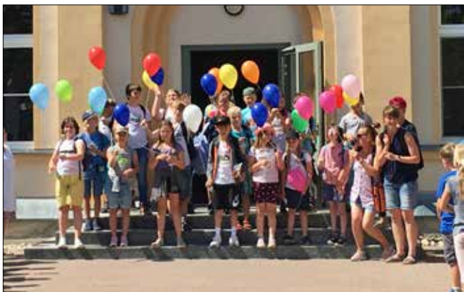
Das Team der Grundschule Teichwolframsdorf

Schließlich gab es am Freitag Zeugnisse und wir verabschiedeten unsere Klasse 4. Sie hatte ein tolles Programm einstudiert und zeigte es allen. Die waren sehr begeistert und es gab tosenden Beifall. Nach der Zeugnisausgabe ließen die Viertklässer ihre Wünsche am Luftballon steigen. Anschließend wanderten sie zum Abschiedsnachmittag nach Waldhaus. Zum Schluss hieß es Abschied nehmen – neben der Vorfreude auf etwas Neues rollte auch die ein oder andere Träne. Wir wünschen unseren „Großen“ einen guten Start in ihren neuen Schulen und alles Gute!