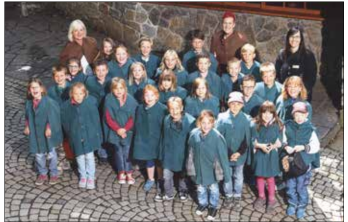
Abwechslungsreiche Tage erlebten die Hortkinder unserer Grundschule Teichwolframsdorf in den Sommerferien. Neben vielen anderen Highlights stand eine Ausfahrt in die Saalfeder Feengrotten auf dem Programm.