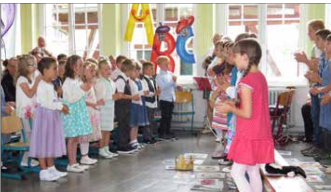
Die Schüler der Klasse 1 – 2016 bei der Feierstunde zum Schulanfang in der Grundschule Mohlsdorf.