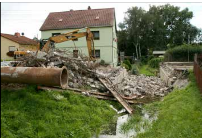
Da liegt sie, die alte Reudnitzer Brücke bevor der Neubau beginnt.