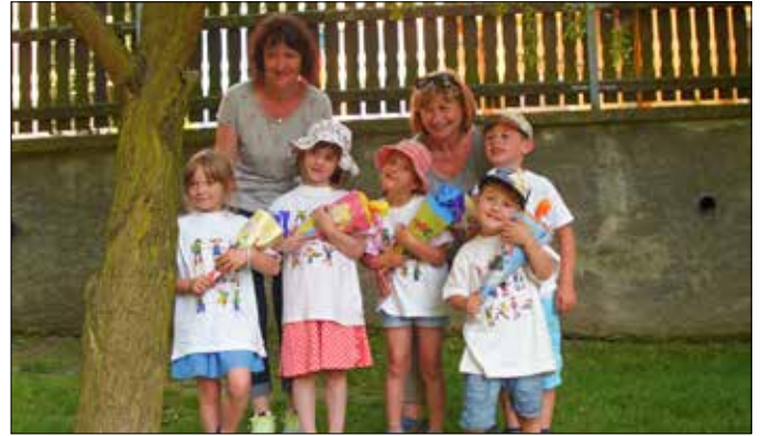
Team der Kita „Gänseblümchen“ Waltersdorf

schon von den Eltern erwartet und tatsächlich..... Der ZUCKERTÜTENBAUM trägt Früchte und für jeden Schulanfänger ist eine große Zuckertüte am Baum zu sehen. Die Kinder freuten sich riesig und eine kleine Erfrischung gab es auch noch. Abgekämpft aber glücklich lassen wir den aufregenden Tag ausklingen. Die Kinder haben viel gesehen, gelernt und es wird noch viel zu Hause zu erzählen geben.