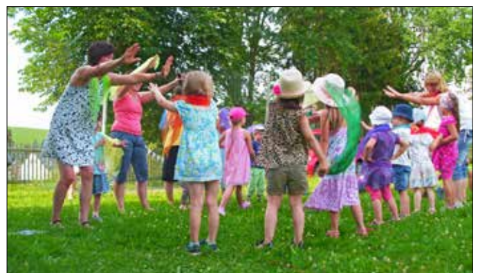
Das Team der Kita „Gänseblümchen“