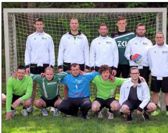
Die Tourniersieger vom HV Fortschritt Mylau-Reichenbach

Zufriedene Gastgeber und Teilnehmer ließen den Tag im Festzelt ausklingen und wollen sich im nächsten Jahr wieder treffen.