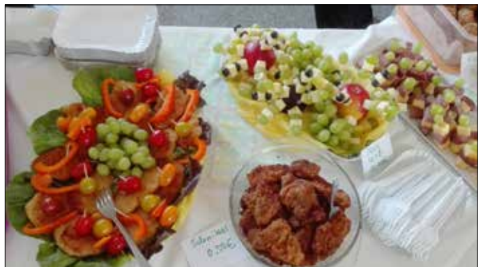
Großartig! – Am 16. Mai 2017 machten die Eltern der Kinder der Klasse 3 ein süßes und herzhaftes Büfett. Unsere Schulkinder und auch die „Großen“ aus dem Kindergarten staunten sehr und aßen sich dann richtig satt. Schnitzelchen, Klopse, Obstspieße, Würstchenraupen, Kuchen, Eiermäuse, Gurkenlutscher, Wackelpudding, Obstschorle und vieles mehr luden zum Kosten ein. Vielen, vielen Dank dafür! Der Erlös kommt wieder in unsere Klassenkasse – unser Abschlussfest wird toll. Klasse 3 und Frau Lüttchen, Grundschule Mohlsdorf