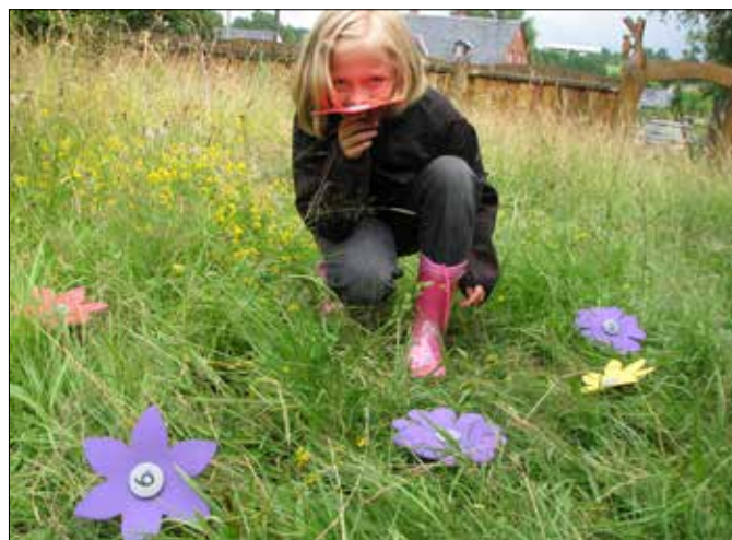
Beim „Schnupperspiel“ müssen die richtigen Düfte zugeordnet werden