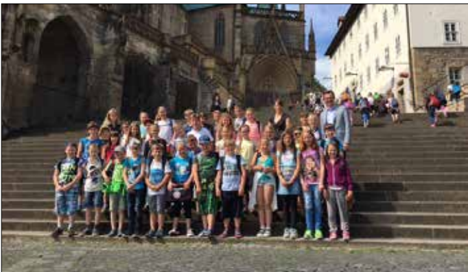
Kurz vor Schuljahresende waren die „Großen“ der Grundschule Teichwolframsdorf in Erfurt und erlebten eine Stadtführung und den Landtag hautnah.