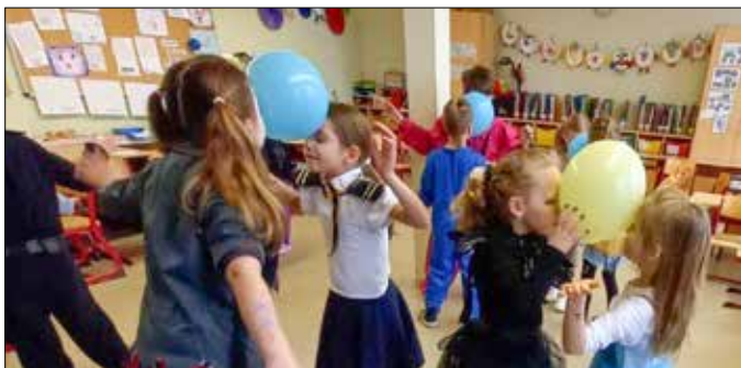
Die Schüler und Schülerinnen der Grundschule Teichwolframsdorf