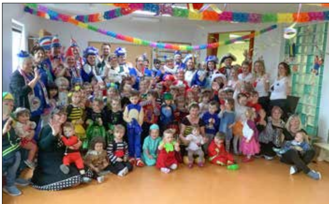
Die Kinder und das Team der Kita „Sonnenschein“

Die Kinder sind kostümiert, lustige Musik ertönt und alle sind gut drauf – es heißt wieder: Fasching in der Kita Sonnenschein. Am 21. Februar 2023 feierten wir mit Spielen und Tänzen die 5. Jahreszeit. Ein großes DANKE SCHÖN geht an den Teichwolframsdorfer Carnival Club, der uns wie jedes Jahr besuchte und die Stimmung mit Animation und viel Kamelle auf das nächste Level anhob. So hatten alle zusammen einen tollen Vormittag mit Musik, Bewegung, Leckereien und das Wichtigste: viel Spaß.