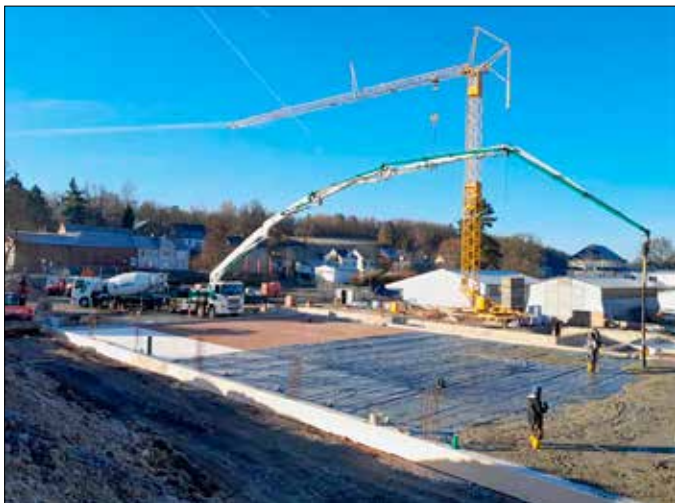
Herstellung der Bodenplatte für den neuen Markt