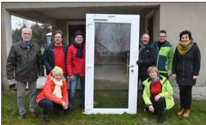
Am Samstag, 29.01.2022 übergab der Skiclub eine materielle Spende in Form einer Eingangstür an die Projektbeteiligten.

Der Turn- und Spielgemeinschaft „Concordia“ Reudnitz e.V. wurden Fördermittel in Höhe von ~76.000 Euro für die Sanierung des gemeindeeigenen Mehrzweckgebäudes am Sportplatz Reudnitz bewilligt. Mit einer Gesamtinvestition von mehr als 100.000 €, werden durch die am Projekt Beteiligten auch finanzielle Eigenmittel aufgebracht, das verdient unser aller Anerkennung.